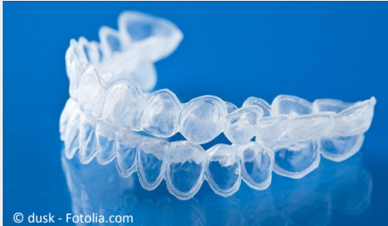
Bleaching-Form aus Kunststoff, in die Sie das Aufhellungs-Gel einfüllen.

Beim Home-Bleaching werden vom Zahnarzt dünne flexible Formen aus einem transparenten Kunststoff hergestellt, die genau auf Ihre Zähne passen (siehe Foto).