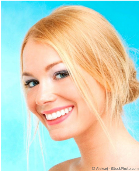
Bleaching vom Zahnarzt: Gewinnendes Lächeln mit strahlend weißen Zähnen

Professionelle Zahnaufhellung durch den Zahnarzt