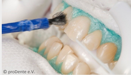
Power-Bleaching beim Zahnarzt: Auftragen des Bleaching-Gels

Wenn Sie die Praxis wieder verlassen, können Sie sich an sichtbar helleren Zähnen freuen!